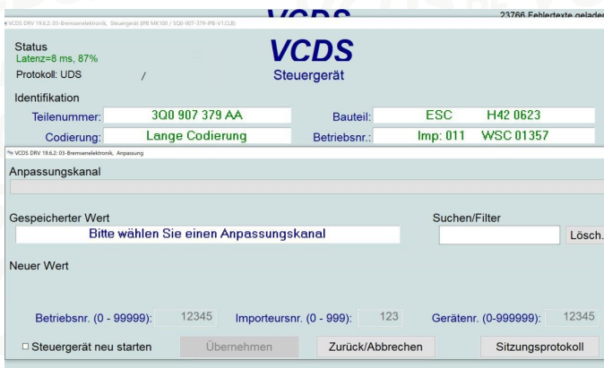
Abbildung 2: Anpassung in Bremsenelektronik

Es kann weiterhin nötig sein eine Anpassung durchzuführen. Dies geschieht mit der Funktion Anpassung im jeweiligen Steuergerät. Häufig ist dies beim Steuergerät für Bremsenelektronik notwendig, um die Gespannstabilisierung zu aktivieren. Hierbei besteht die Möglichkeit über ein Dropdownmenü eine Auswahl zu treffen.